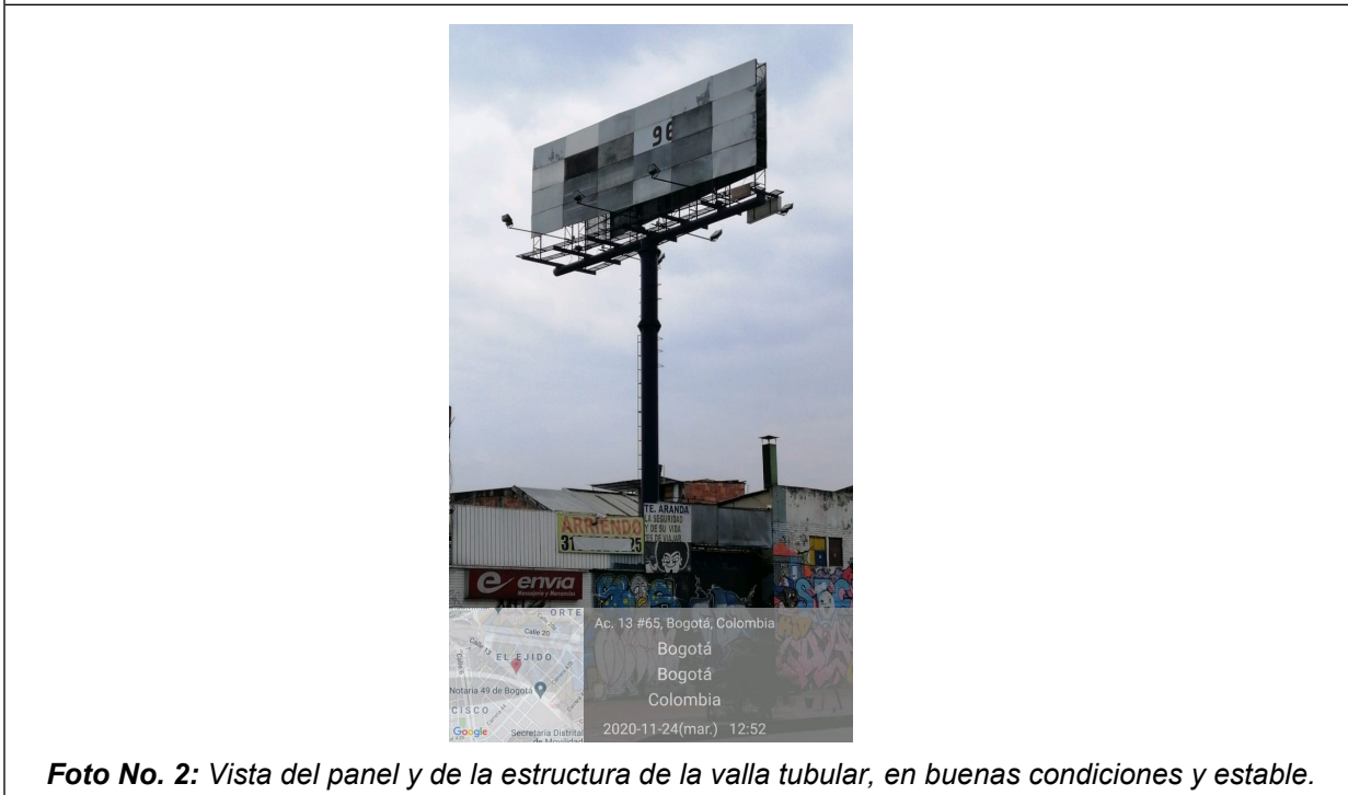
Foto No. 2: Vista del panel y de la estructura de la valla tubular, en buenas condiciones y estable.