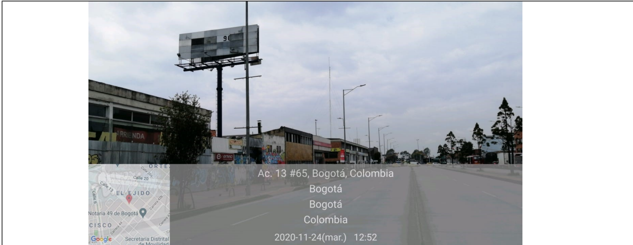
Foto No.1: Vista panorámica del predio y de la valla ubicada en la Avenida Calle 13 No. 44 - 73 (dirección catastral) orientación Este-Oeste